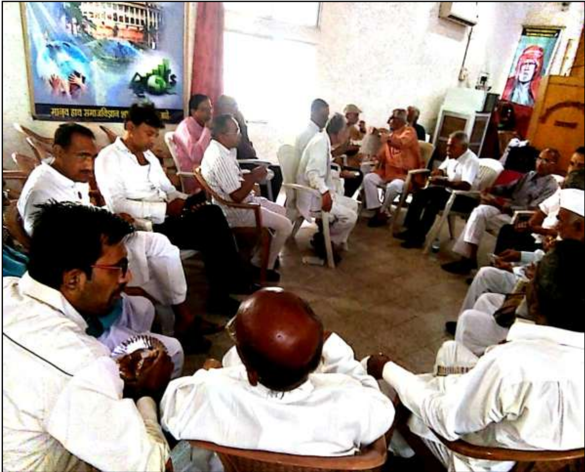
DISCUSSION SESSION WITH THE FARMERS